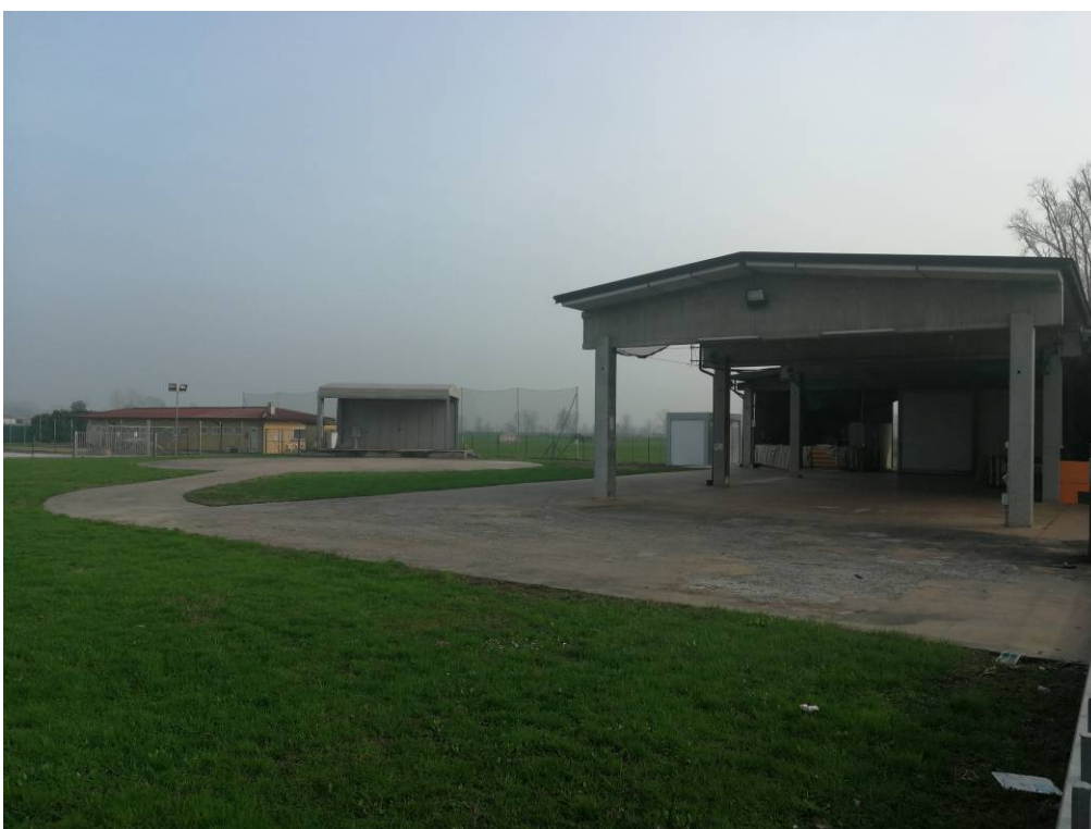
Fotografia nr. 6 – Area oggetto di intervento