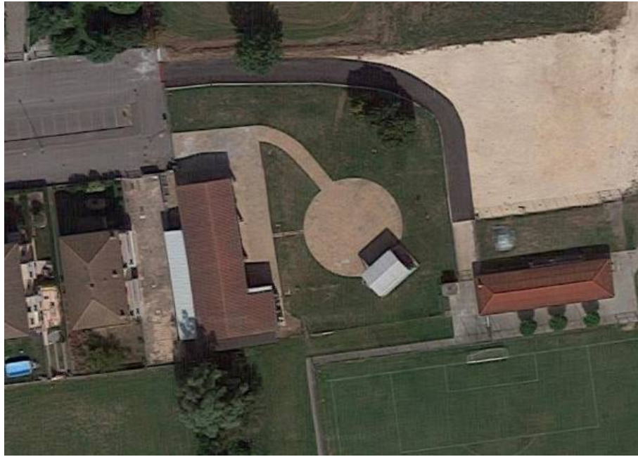
Fotografia nr. 2 – Particolare dell'ortofoto aerea con individuazione dell'area oggetto di intervento