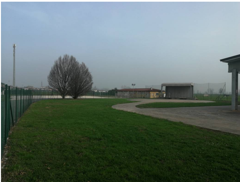
Fotografia nr. 5 – Area oggetto di intervento