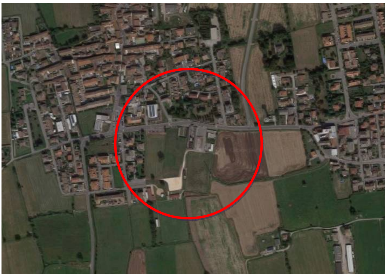
Fotografia nr. 1 – Ortofoto con individuazione dell'ambito di intervento a sud del centro abitato

L'ambito oggetto di intervento è rappresentato dallo spazio adibito ad area delle feste di via Ugo Foscolo che è una parte del vasto complesso di aree di proprietà comunale, poste a sud del paese e rappresentate dal centro sportivo avente una estensione complessiva di oltre 33.000 mq.