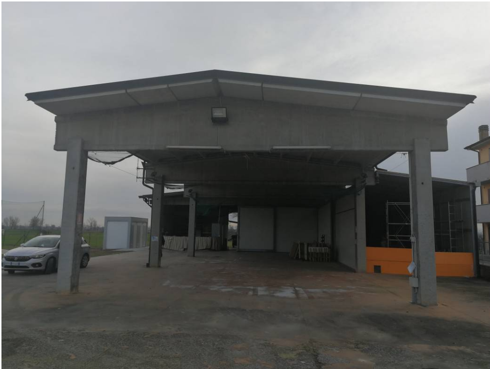
Fotografia nr. 4 – Struttura prefabbricata oggetto di intervento

La struttura, avente una superficie di 400 mq circa, è stata costruita utilizzando i modelli tipici dell'edilizia prefabbricata (spesso utilizzati nei casi di edilizia rurale) e si compone di un fabbricato a forma di "L" quasi totalmente aperta al quale è stato aggiunto nel corso degli anni un corpo accessorio con destinazione magazzino.