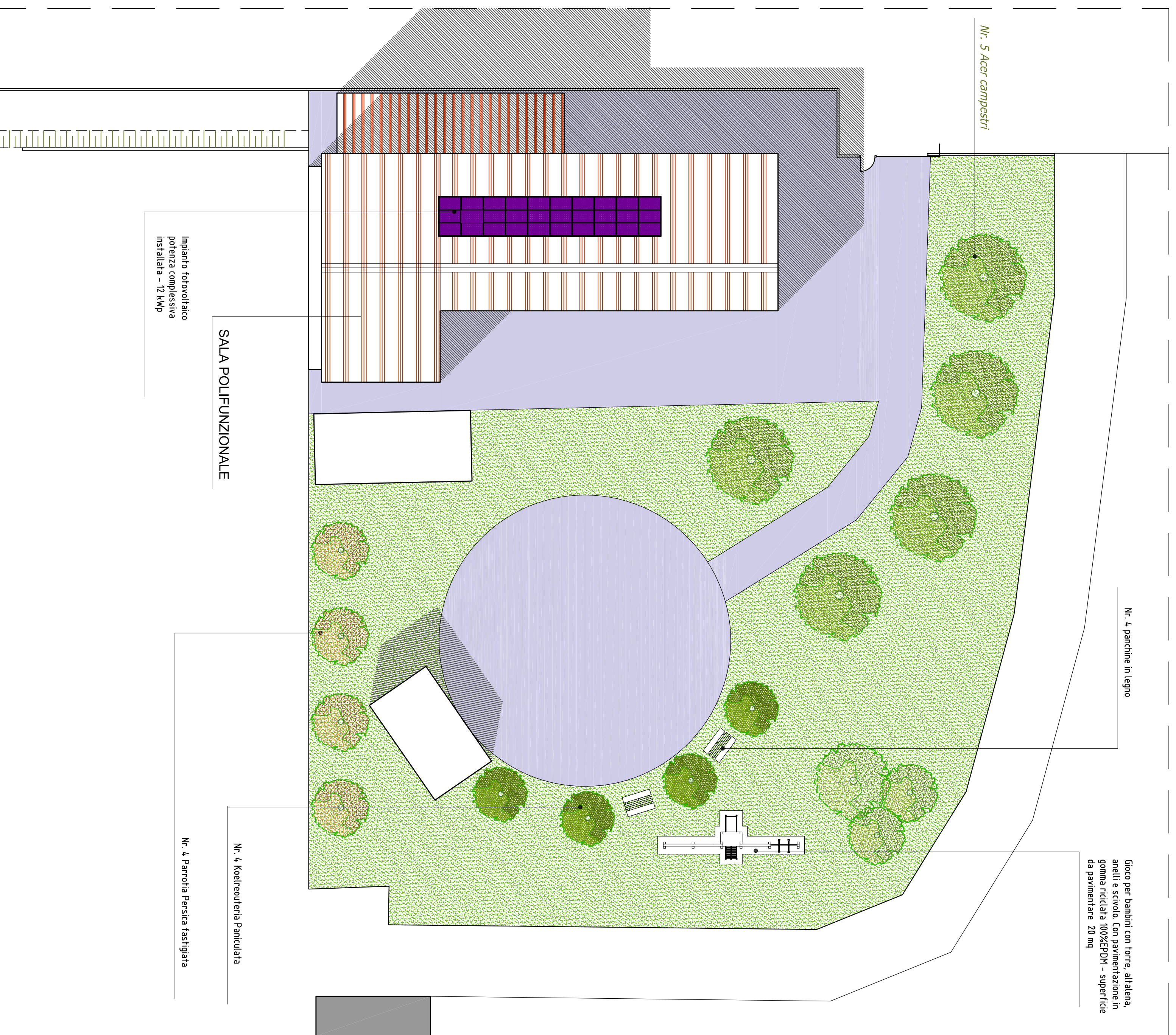
PLANIMETRIA GENERALE CON IDENTIFICAZIONE OPERE IN PROGETTO SCALA 1:200